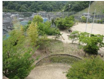
整備がすすむ冒険の森→

本校は、被爆50周年を記念し、1995年に開始した「ひろしま2045ピース&クリエイト」事業の一つとして新設されました。15周年目の節目を迎える本年度は、本校の使命とも言える「平和と創造」の原点に立ち戻り、人間との共生、自然との共生の在りようを探っていきたいと思えます。